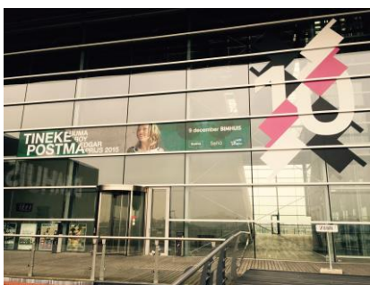
In de weken voorafgaand aan de concertavond met prijsuitreiking op 9 december, hing een foliebanner van 12 x 1,5 meter met aankondiging van deze feestelijke avond aan de voorgevel van het Muziekgebouw aan 't IJ.